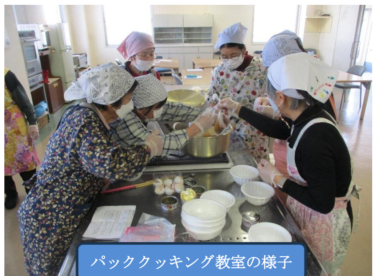
パッククッキング教室の様子

ポリ袋(高密度ポリエチレン袋)に食材と調味料を入れて空気を抜き、鍋や電気ポットなどで加熱する調理方法。災害時などにも活用できます。